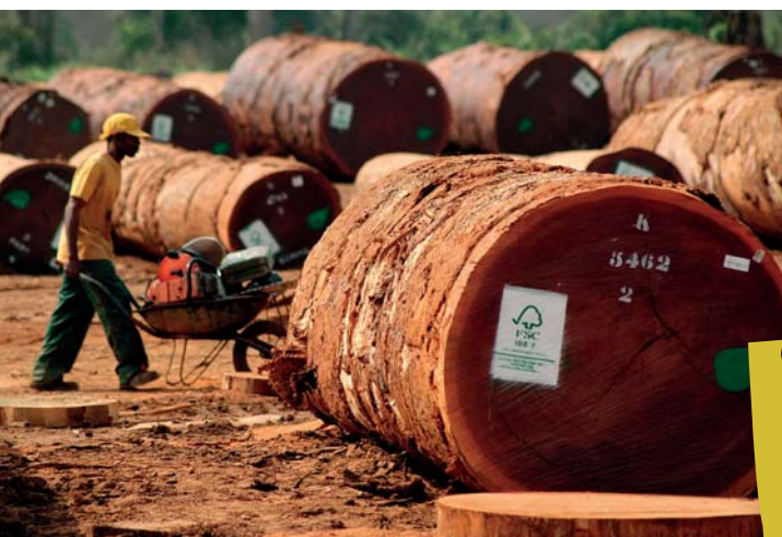
Grume certifiée FSC sur chantier CIB

Acheter des bois issus de forêts gérées durablement. C'est la meilleure réponse aux critiques sur l'importation de bois illégaux.