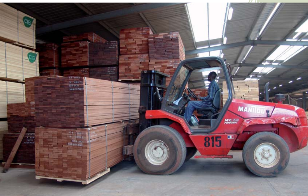
Usine CIB

L'industrie forestière sous aménagement, préserve l'environnement et est un levier pour le développement économique et social des pays forestiers.