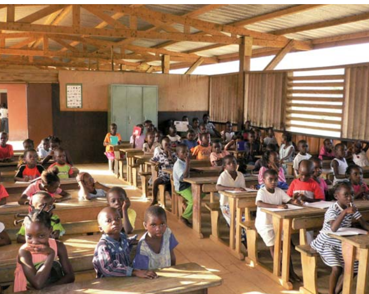
L'école de Babylone au Gabon

Depuis une dizaine d'années, plus de la moitié des pays africains a élaboré une nouvelle politique forestière qui prend en compte des mesures pour augmenter la participation des populations locales dans les activités de récolte forestière.